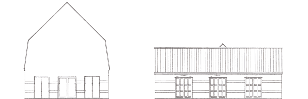
Facade mod øst