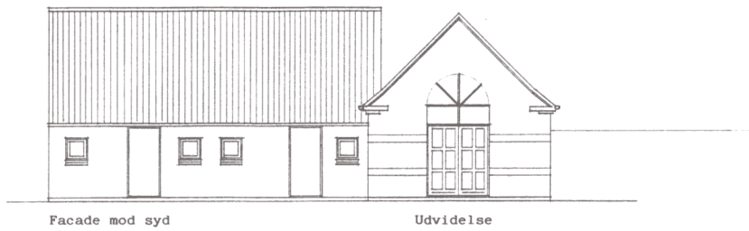
Facade mod syd